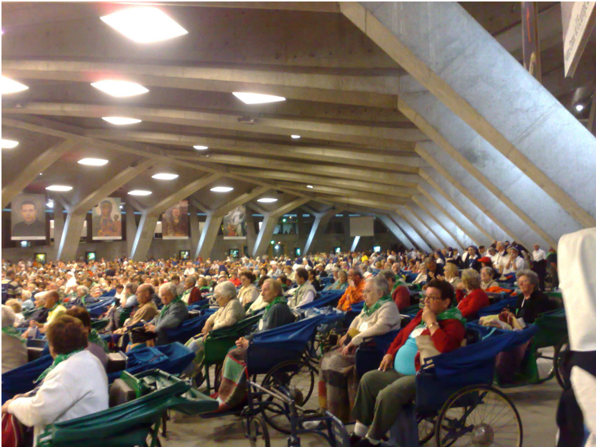
Lourdes: Basilica di san Pio X°

San Pio X°, capace di accogliere ben 27.000 persone, ove presenziamo alla processione dell'Eucaristia; dopo rientro in camper per la cena e ritorno al santuario per partecipare alla fiaccolata.