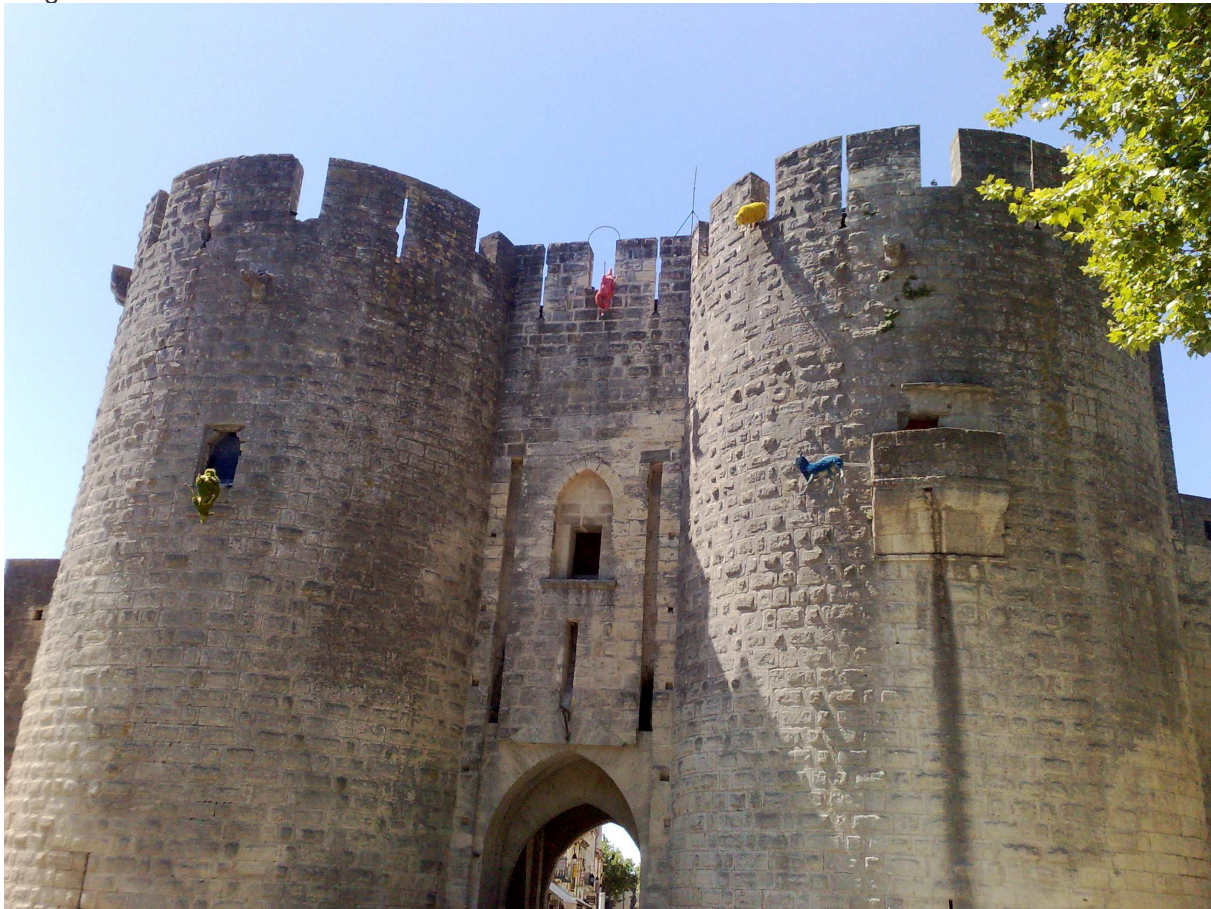
Ingresso al borgo di Aigues Mortes

Dopo l'acquisto di vari ricordini, pranzo, pulizia camper, docce, provvista di acqua e partenza alla volta di Carcassonne dove giungiamo verso le ore 20,30; troviamo subito l'area di sosta della città, entriamo previo pagamento di € 10,00, ci sistemiamo e facciamo la nostra prima visita notturna al borgo.