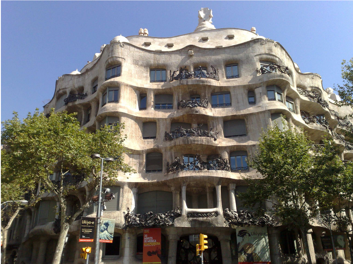
Barcelona: Casa Milà detta anche la Pedrera