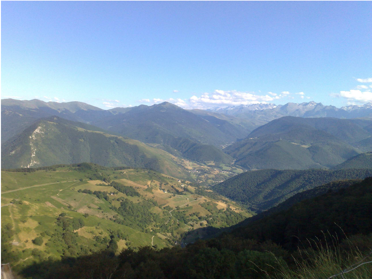
Col D'Aspin metri 1489 Martedì 5/8/2008

per potersi allacciare altrimenti si resta senza corrente). Sistemato il camper ci spostiamo a piedi verso il metrò che dista circa 10 min. di strada ; dopo aver acquistato nella macchina automatica un biglietto che comprende 10 corse della durata massima di h 1 e 15 min. ciascuna su tutti i mezzi pubblici(€ 7,20), prendiamo cognizione delle varie linee seguite dal metrò, ampiamente pubblicizzate all'interno delle varie stazioni, quindi saliamo con l'intenzione di visitare Montjuic e la fontana magica ma colà giunti veniamo a sapere, rivedendo anche con maggiore attenzione le notizie di cui disponiamo, che tale fontana viene messa in funzione nei giorni di Giovedì, Venerdì , Sabato e Domenica per cui non ci resta altro che accontentarci della vista panoramica notturna della città e della passeggiata nei giardini. Dopo rientro in camper, doccia ed a nanna.