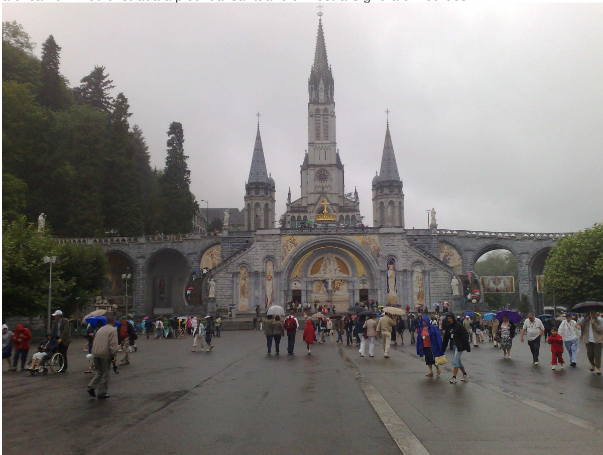
Lourdes : Santuario di N.S. di Lourdes

a circa 10 minuti di strada a piedi dal santuario di Nostra Signora di Lourdes.