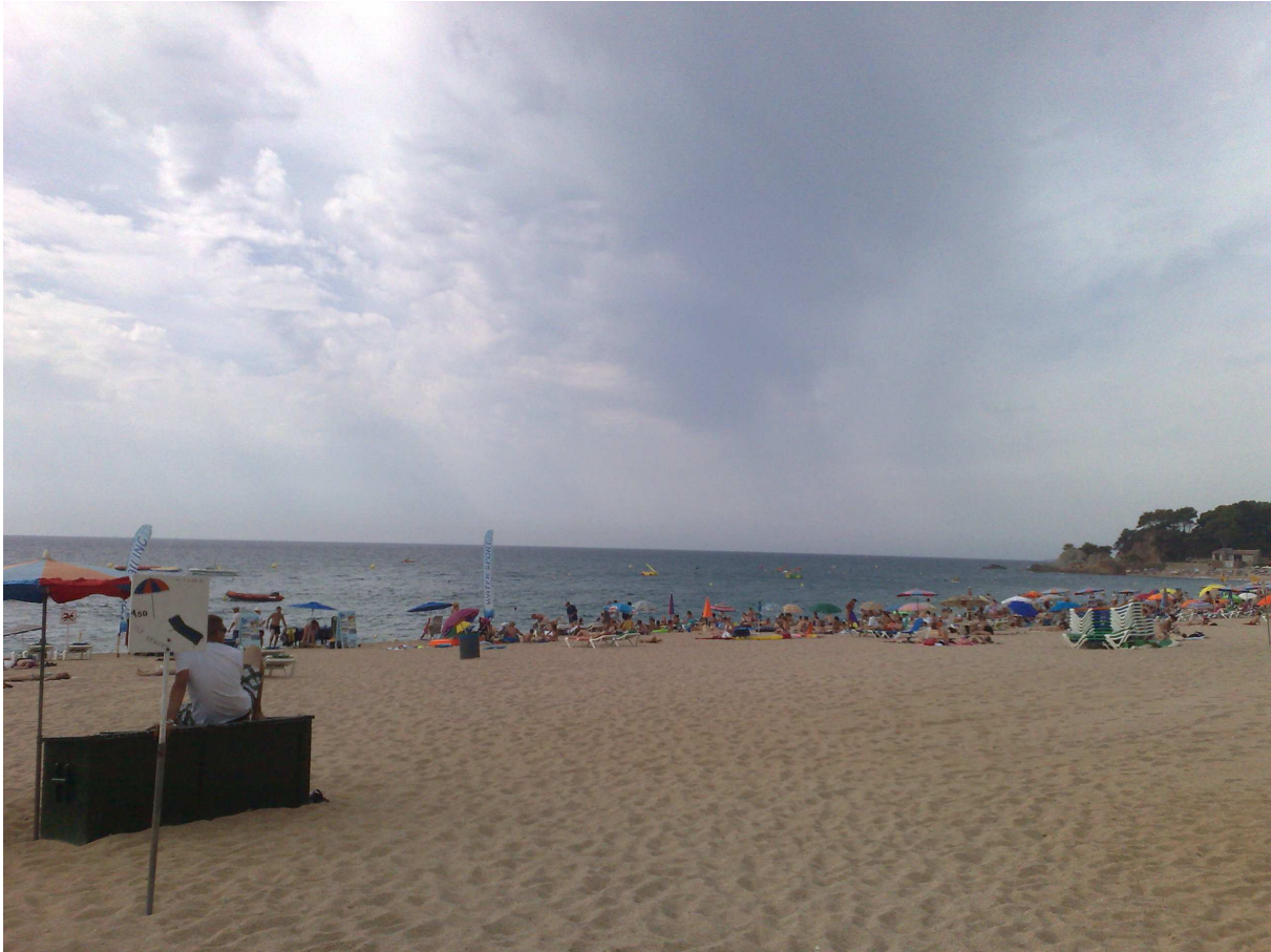
Spiaggia di Lloret de Mar